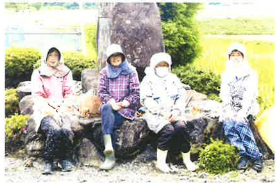
〔中上林地区〕除草作業