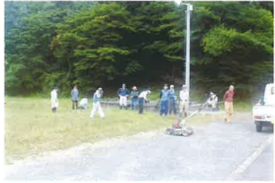
〔東八田地区〕除草作業