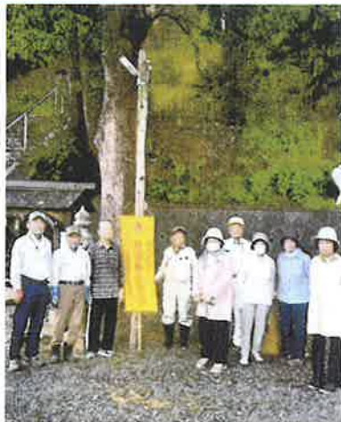
〔綾部地区〕 斎神社境内清掃