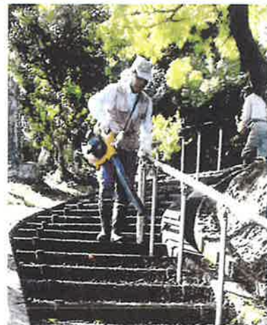
〔綾部地区〕 公会堂周辺除草作業