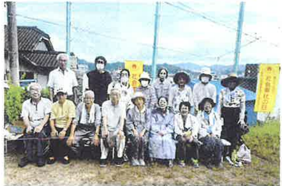
〔綾部地区〕 児童公園除草作業