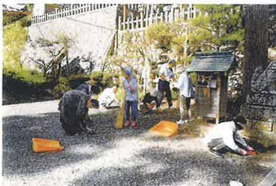
〔綾部地区〕 氏神境内清掃