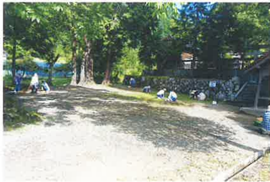
〔東八田地区〕篠神社境内