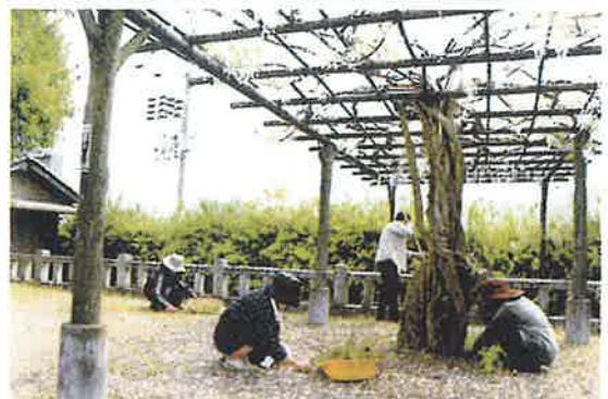
〔綾部地区〕 氏神境内除草