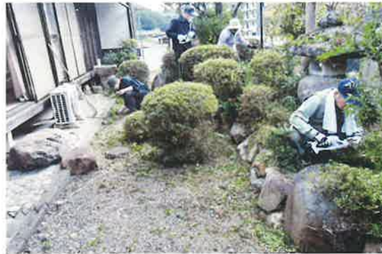
〔綾部地区〕 剪定作業