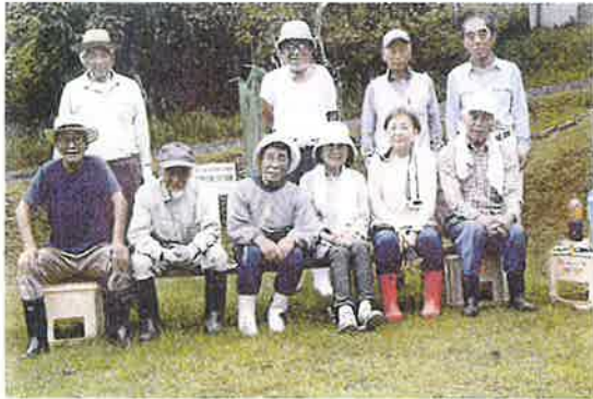
〔綾部地区〕 児童公園清掃作業