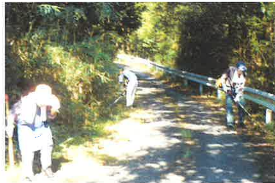
〔物部地区〕 環境美化作業