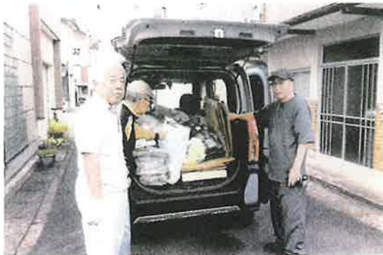
〔綾部地区〕 町内美化作業と廃品回収