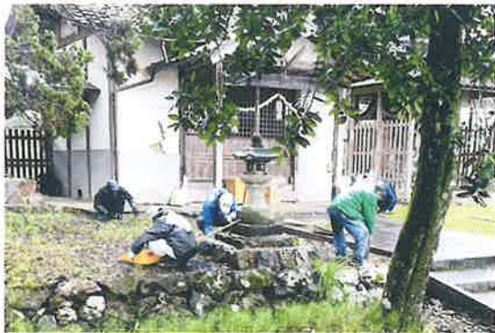
〔中上林地区〕氏神境内清掃