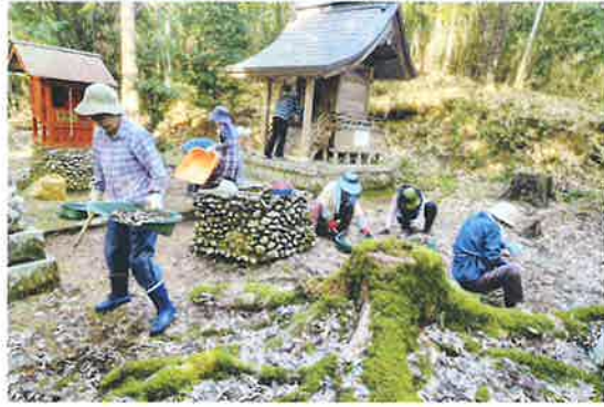
〔東八田地区〕三柱神社美化作業