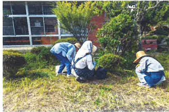
〔志賀郷地区〕 小学校のPTAと合同清掃