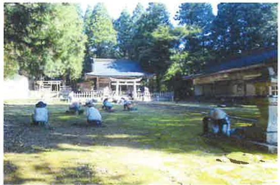
〔中上林地区〕除草作業