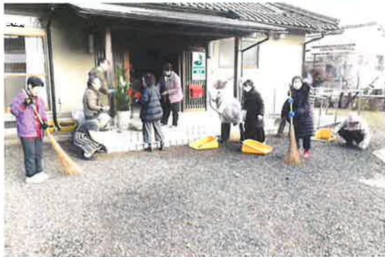
〔中筋地区〕 美化作業