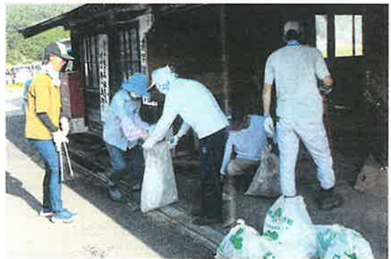
〔中上林地区〕公民館清掃作業