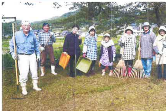
〔西八田地区〕 グラウンド美化作業