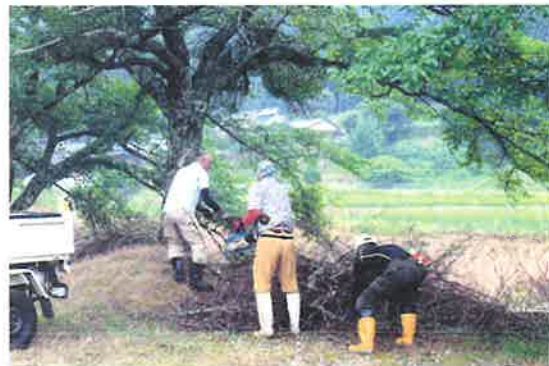
〔奥上林地区〕 伐採作業