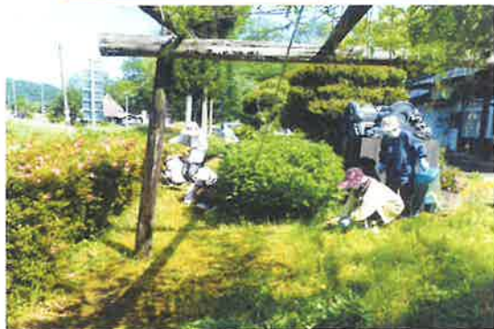
〔物部地区〕 公民館周辺除草