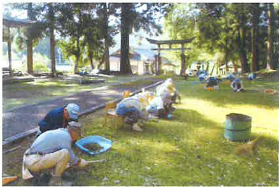
〔中上林地区〕八幡宮掃除